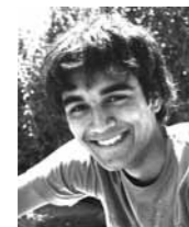
Gabriel Zimmerer Sozial- anthropologie